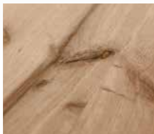
Eiche Wild | Rustic Oak