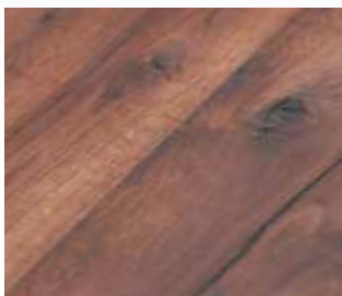
Eiche Antik | Oak Antique

Eine Kombination aus Furnier und Massivholz, das ist FUMAKO von Kaindl. Schon im Mittelalter wurde im Möbelbau günstiges Weichholz mit einem wertigen Sägefurnier belegt. Neu ist das Prinzip also nicht, doch nun wesentlich verfeinert: FUMAKO besteht aus einer massiven Holzplatte, die mit einem Messerfurnier in verschiedenen Furniervarianten belegt wird. Als Trägermaterial dient eine keilgezinkte Holzplatte, verfügbar in drei Stärken. Den rustikalen Charakter bekommt FUMAKO durch die schönen Charismo-Furniere, etwa Eiche Antik, Eiche Wild, Eiche Astig oder attraktive Nadelhölzer wie zB. Zirbe. Gut kombiniert!